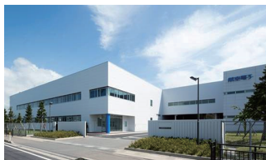
弘前航空電子外観