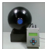
LED電子色票原型の試作機