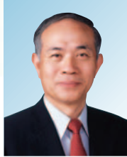
代表理事 会长 中钵 良治 索尼株式会社 取缔役代表执行董事 副会长 综合政策、宣传、调查统计、 税制、资材、绿色IT推进协议会、 政策相关负责人