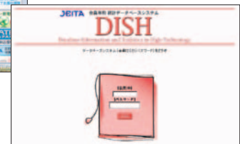
会员专用数据库系统“DISH”