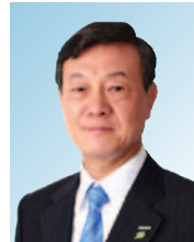
副会长 大坪 文雄 Panasonic株式会社 代表取缔役会长 环境负责人