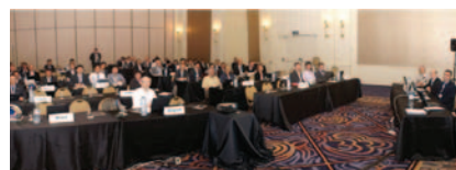
IEC TC111（电工电子产品和系统的环境标准化）国际会议