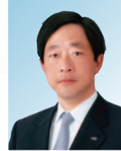
副会长 片山 幹雄 夏普株式会社 取缔役会长 通讯广播电视负责人