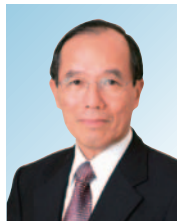
副会长 矢野 薰 日本电气株式会社 取缔役会长 通商负责人